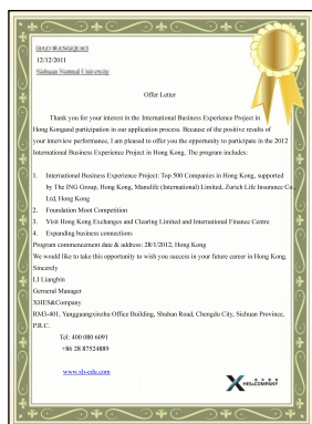
英文版录取通知书

(2) 面试通过者，信华教育工作人员会在当天发出电子版录取通知书，并在接下来的5个工作日内向同学寄发录取通知书和专用收费凭证；