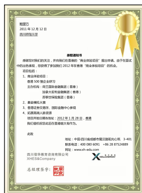
中文版录取通知书